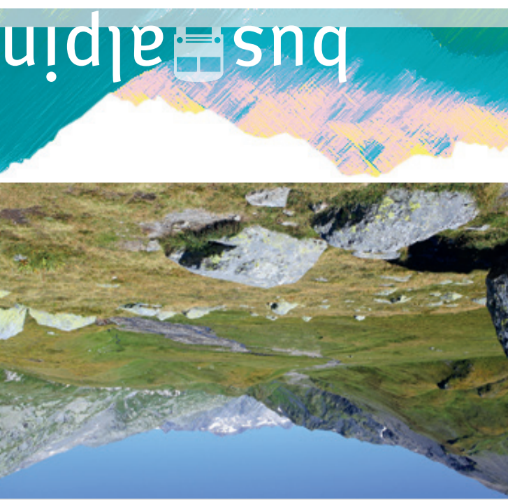
Valle di Blenio – Sumvitg – Valle Lumnezia